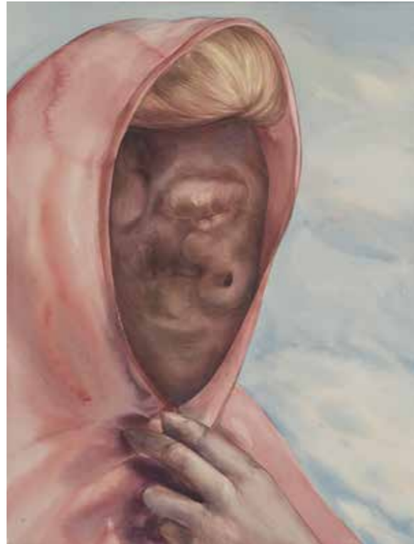
↗ Oda Jaune Sans titre , 2015 Aquarelle sur papier 45,5 x 35 cm