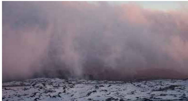
↗ Marco Godinho Notes sur cette terre qui respire le feu Installation vidéo Production Labanque 2017