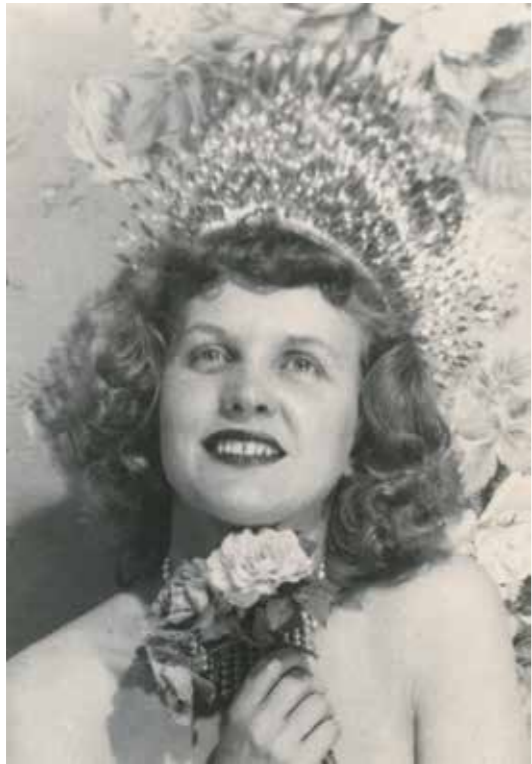
↗ Eugène von Bruenchenhein Sans titre (Marie) , circa 1940 Tirage argentique (tirage unique original) 17,8 x 12,7 cm