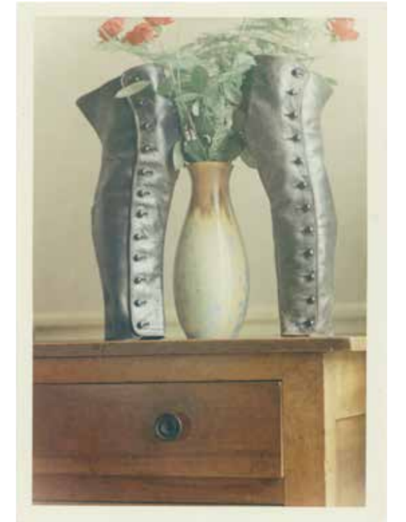
↗ Zorro 1968 Tirage chromogène, fac-similé. 12,7 x 9 cm