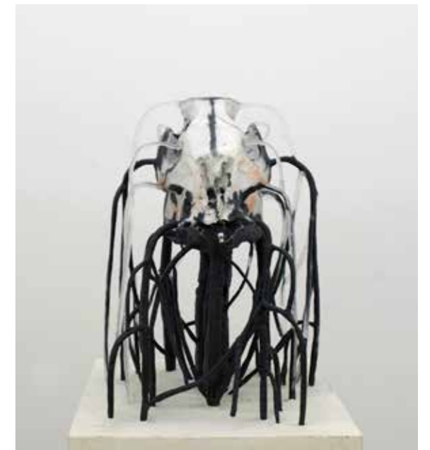
↗ Pia Rondé et Fabien Saleil Crâne, 2017 Os, pâte de cristal, plâtre, acier, 120 cm x 45 cm x 45 cm, Courtesy de l'artiste et de la galerie Escougnou-Cetraro