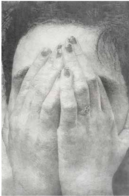
↗ Jérôme Zonder Portait de Garance #2 , 2016 Mine graphite sur papier 200 x 130 cm Courtesy Galerie Eva Hober, Paris Collection privée, Lyon