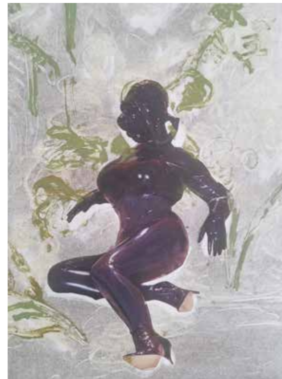
↗ Claire Tabouret Les Étreintes Série de collages et monotypes, dimensions variables Production Labanque 2017