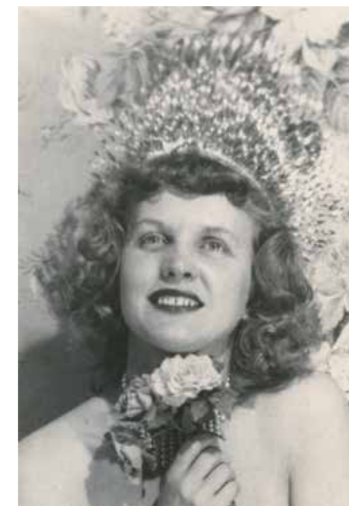
↳ Eugène von Bruenchenhein Sans titre (Marie), circa 1940 Tirage argentique (tirage unique original) 17,8 x 12,7 cm

Les voix d'un homme et d'une femme se font entendre dans l'exposition : elles s'adressent l'une à l'autre, tentent de communiquer depuis l'ancienne salle des coffres de Labanque, à une chambre cossue du premier étage pour l'occasion transformée en cabinet secret. Ces voix pourraient être celles de Georges Bataille et de Laure, sa compagne disparue très jeune. « C'est au sommet d'une hauteur vertigineuse que je chante un alleluiah : le plus pur, le plus douloureux que tu puisses entendre ».