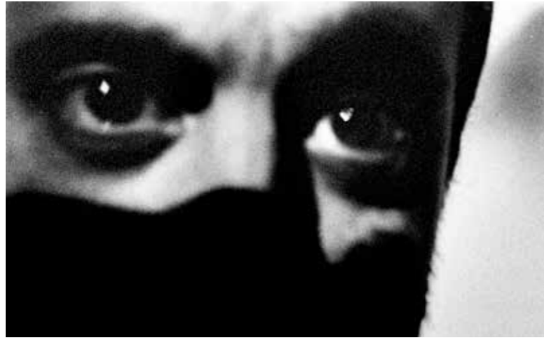
↗ Frédéric D. Oberland Les Larmes de Minos Photographie, tirage numérique sur Kodak Duratrans Prestige, caisson lumineux 120 x 80 cm Production Labanque 2017