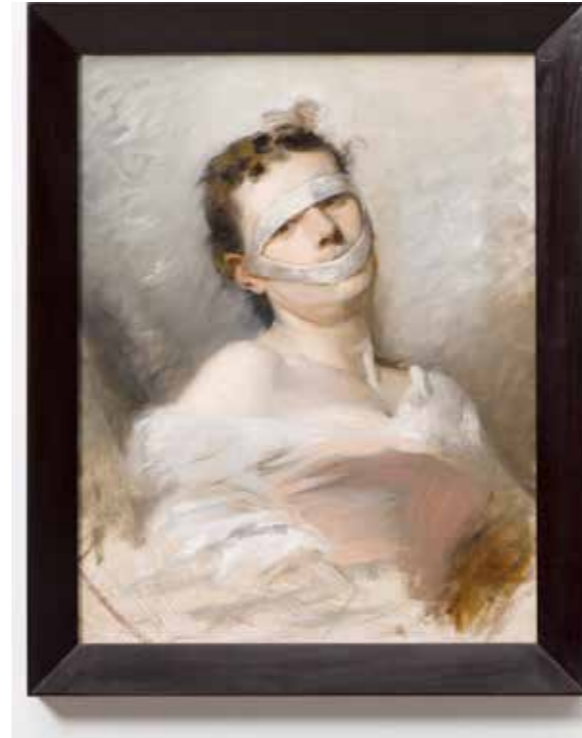
↗ Markus Schinwald Untitled , 2016 Huile sur toile 59 x 47 cm Courtesy Galerie Thaddaeus Ropac, London - Paris - Salzburg © Markus Schinwald ADAGP