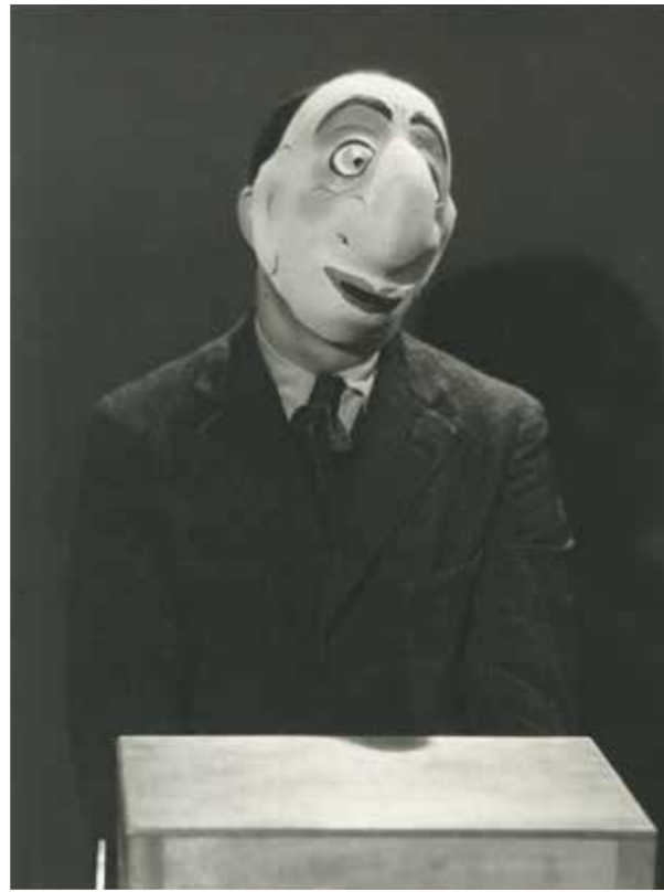
↗ Jacques-André Boiffard Sous le masque, Jacques Prévert , 1930 Epreuve gélatino-argentique, tirage tardif 30,3 x 23 cm Collection privée, Courtesy Galerie 1900-2000, Paris