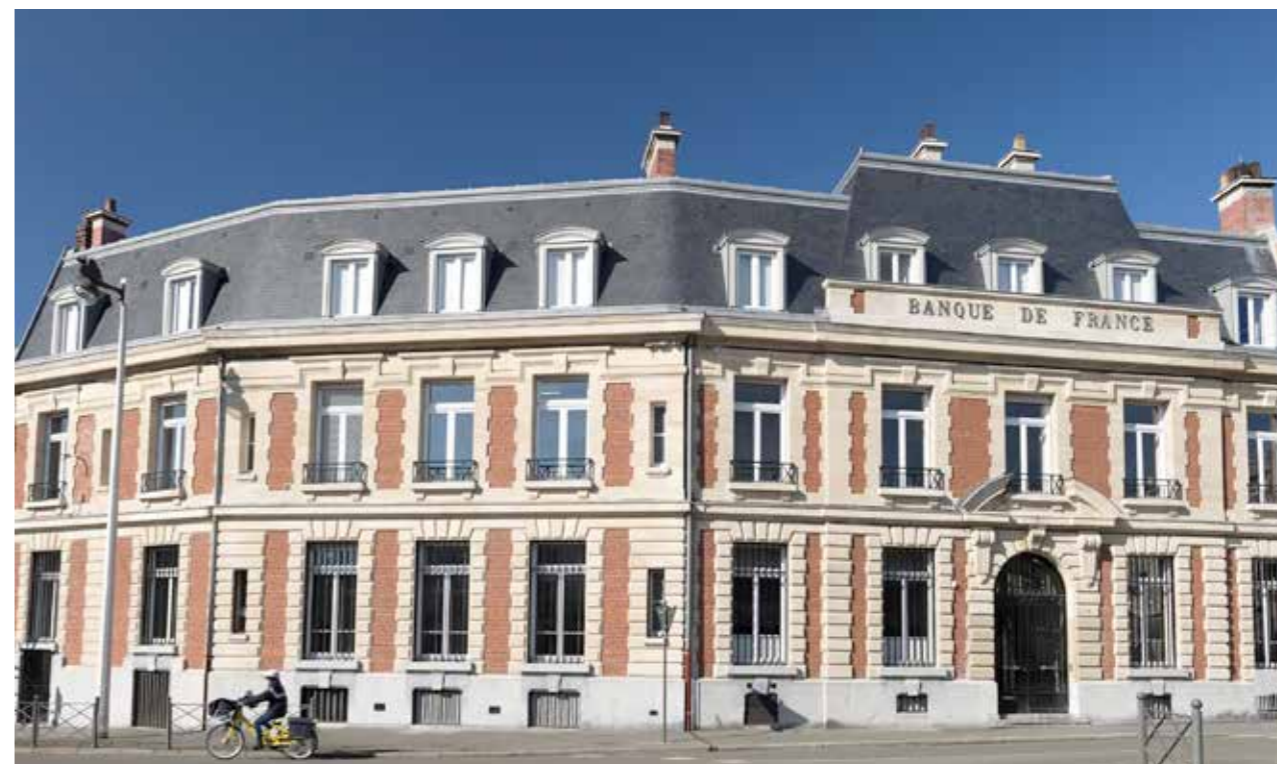
Labanque