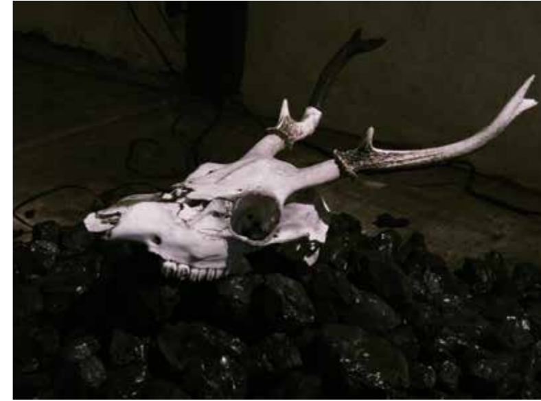
↗ Atsunobu Kohira Kodo, 2017 Crâne de cerf, Bâton d'encre, fil 40 x 20 x 25 cm