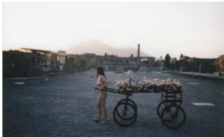
↗ Romina De Novellis Gradiva Production Labanque 2017 coordination Dafna Napoli / en collaboration avec Pompei et Accademia di Belle Arti di Napoli / avec le soutien de Galerie Alberta Pane et Kreemart