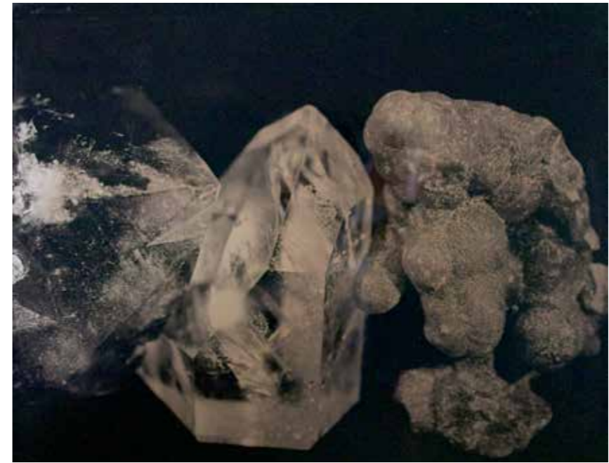
↗ Charlotte Charbonnel Ambroithotype 2 Photographie collodion humide sur verre, 2017 © ADAGP